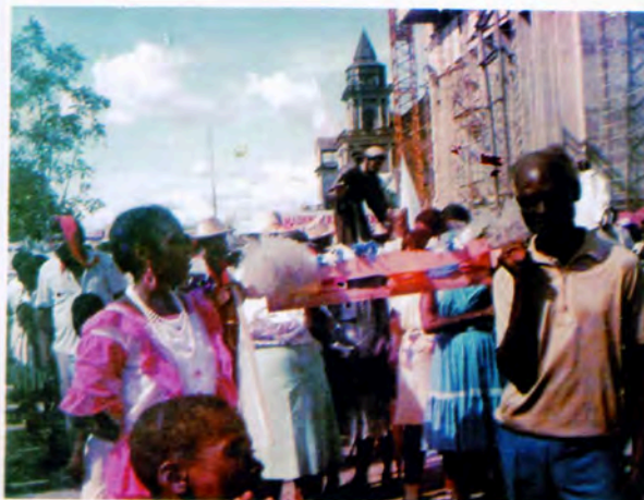
Primer desfile de banderas, 1985

El gran peligro de lo devocional franciscano es que el "Pobrecillo" de Asís