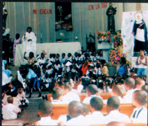
Dialogando con San Francisco de Asís y con San Pachó