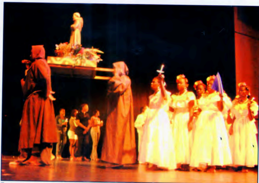
San Pacho en escena

Imaginémonos cómo será el acumulado de la fiesta de San Francisco de Asís, que ya cuenta con 360 años de celebración. Lo que tenemos que quitarnos de la cabeza es que frente a esta fiesta se trate sólo de un elemento religioso, que hay que defender sobre toda otra realidad. Todas las realidades antes mencionadas cuentan en una fiesta patronal y a todas ellas hay que reconocerles su puesto y respetarlas. Quien no se haga cargo de esta realidad nunca podrá entender a fondo el fenómeno social y religioso que representan las fiestas patronales franciscanas para el pueblo quibdoseño.