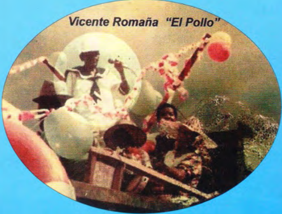
Vicente Romaña "El Pollo"