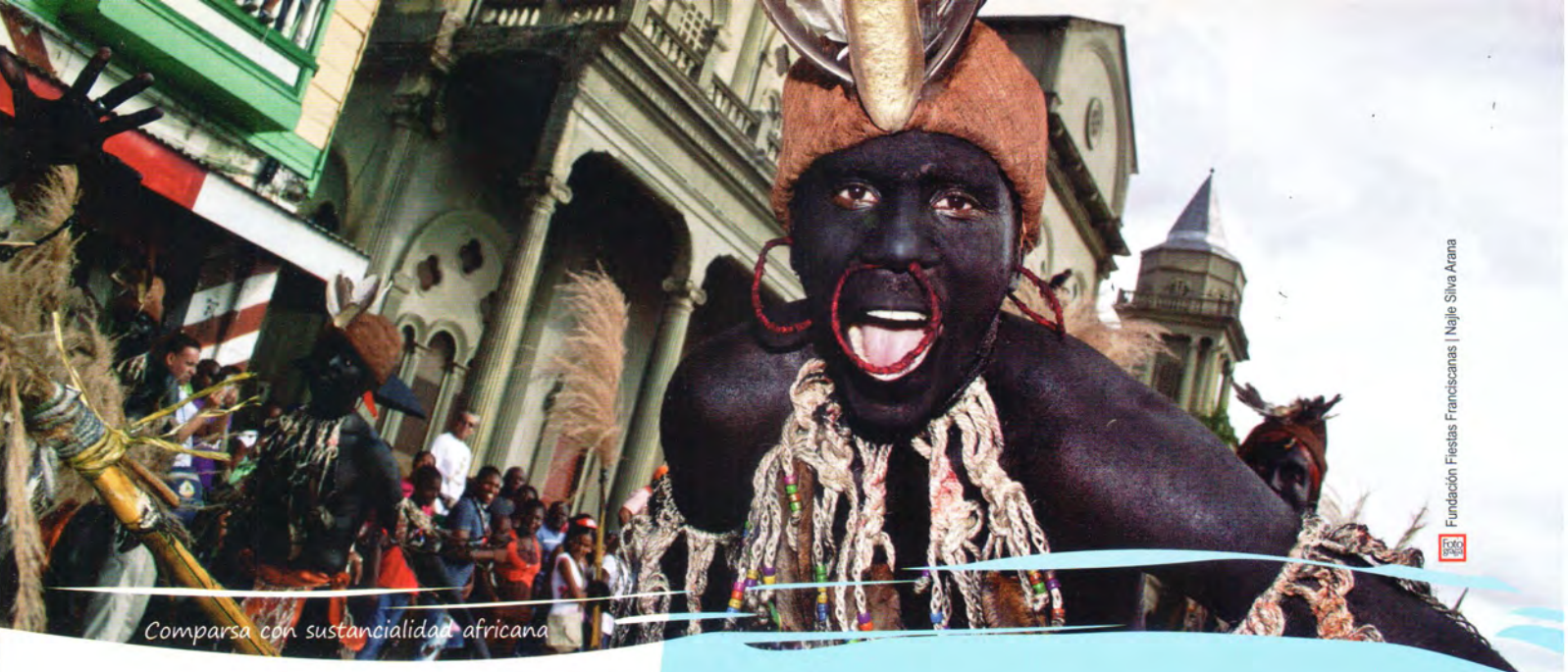
Comparsa con sustancialidad africana