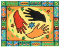
CENTRO CULTURAL MAMA-Ú MISIONEROS CLARETIANOS