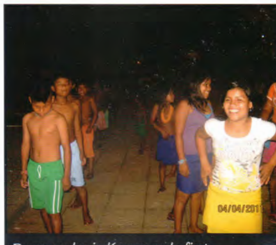
De nuevo los indígenas en la fiesta

Las opiniones expresadas en los artículos firmados son de estricta responsabilidad del autor y no reflejan necesariamente la posición del editor. La reproducción total o parcial de los artículos y fotografías debe llevar el nombre del autor y el crédito de la revista