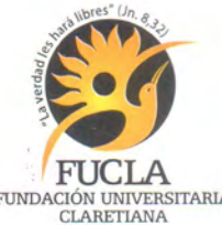
FUCLA FUNDACIÓN UNIVERSITARIA CLARETIANA