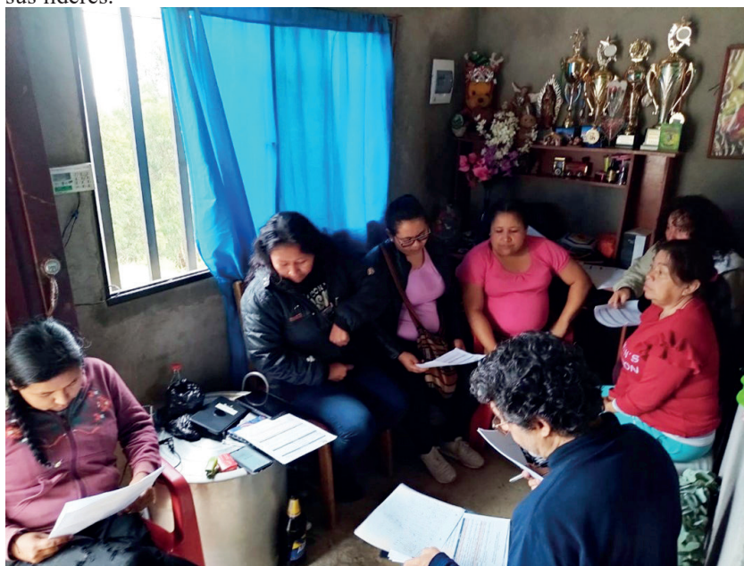
Huerta promovida por las mujeres pertenecientes al grupo Mariposas Hermagas

Definir cómo se configura un liderazgo supuso abordar conceptos claves como el empoderamiento, que es visto desde esta perspectiva como el resultado de los procesos políticos y sociales en los que se insertan las mujeres, ejercen su liderazgo y logran adquirir lugares de poder sobre ellas mismas, para configurar finalmente un proceso emancipatorio. Su desarrollo se explora desde preguntas sobre qué es el liderazgo, cómo se fomenta entre ellas mismas y la comunidad en general; en esta misma vía, el abordaje de los procesos políticos que tengan incidencia directa en las condiciones de vida y bienestar del territorio y, en forma paralela, los procesos de gestión también son incidentes en las acciones sociales y comunitarias, toda vez que en buena medida, la consecución de recursos y procesos de desarrollo se logran como resultado de la autogestión de las mismas comunidades representadas por sus líderes.