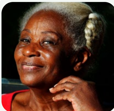
Leonor González Mina