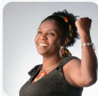
Francia Márquez Mina