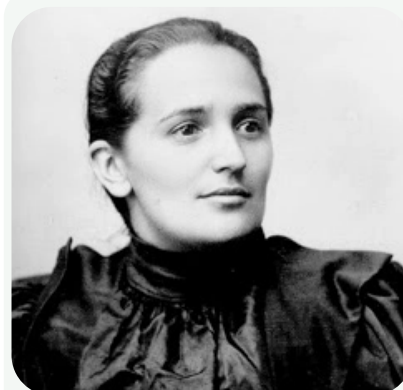
Santa Laura Montoya