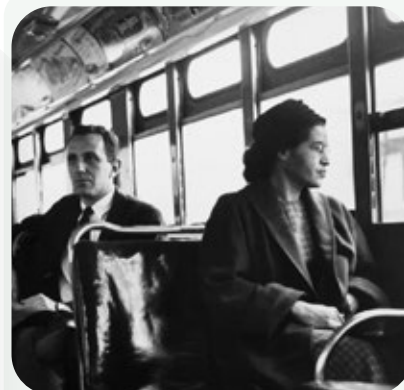
Rosa Parks