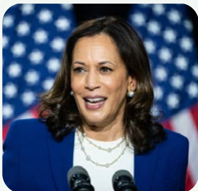
Kamala Harris