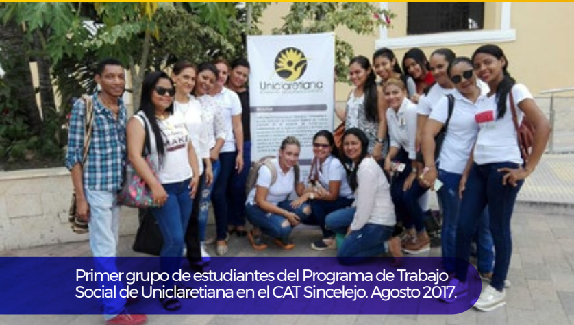
Primer grupo de estudiantes del Programa de Trabajo Social de Uniclaletiana en el CAT Sincelejo. Agosto 2017.