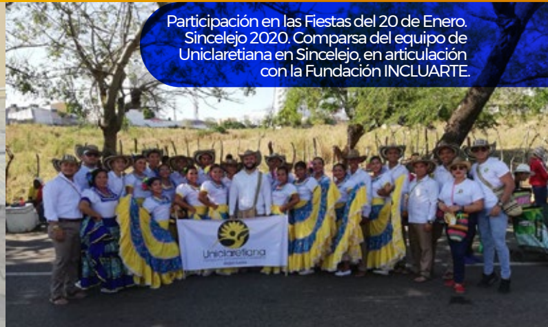
Participación en las Fiestas del 20 de Enero. Sincelejo 2020. Comparsa del equipo de Uniclaletiana en Sincelejo, en articulación con la Fundación INCLUARTE.