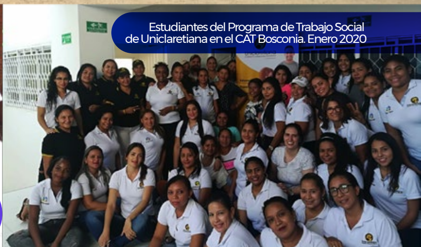
Estudiantes del Programa de Trabajo Social de Uniclaletiana en el CAT Bosconia. Enero 2020