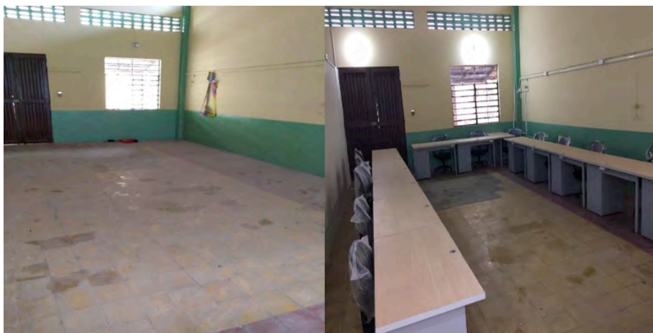
Sede Quibdó: Adquisición del material de trabajo para la nueva sala de profesores: sillas ergonómicas, escritorios y ventiladores.