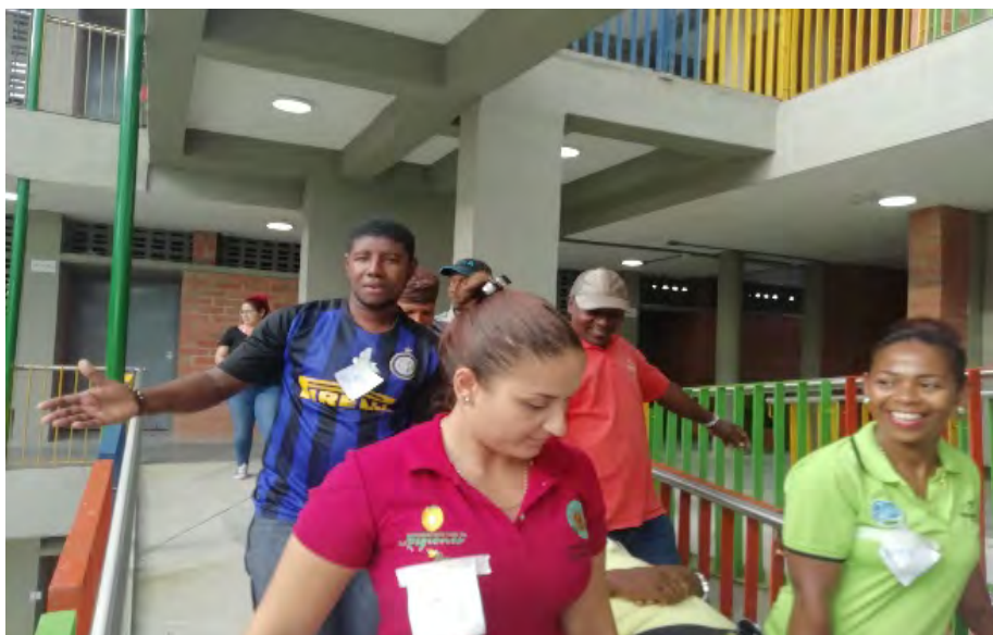
Formacion integral para brigadistas (primero auxilios y rescate)