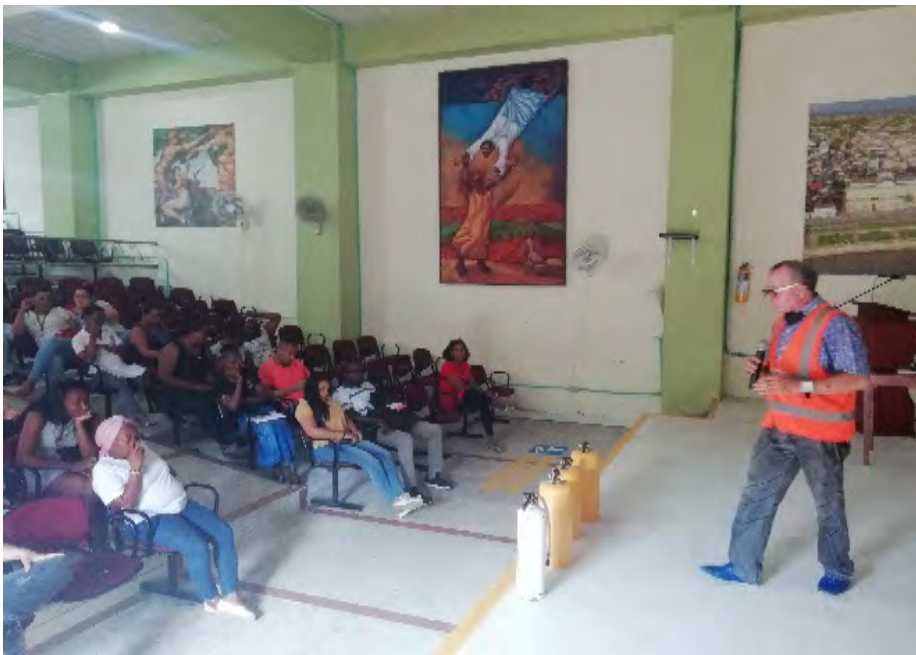
Inducción y reinducción personal administrativo Quibdó